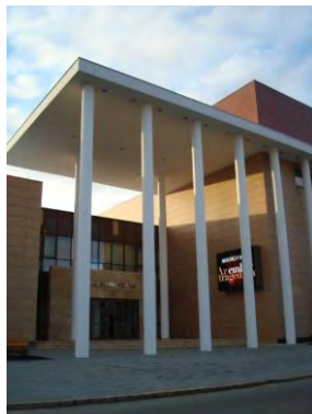
A Weöres Sándor Színház Szombathelyen